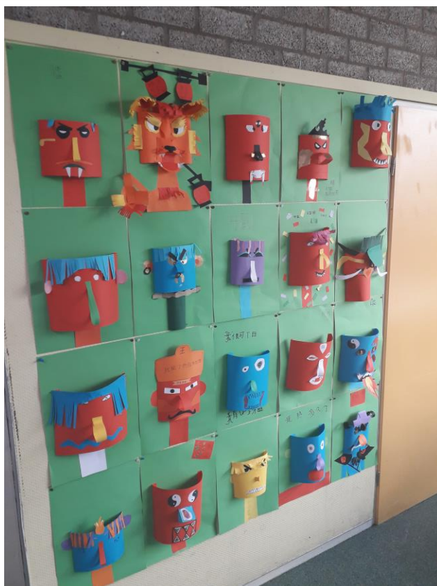
Thema China groep 8