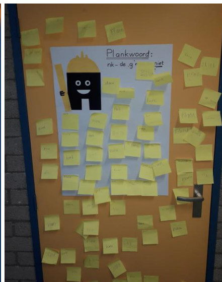
Groep 4a Woorden zoeken met -nk-.