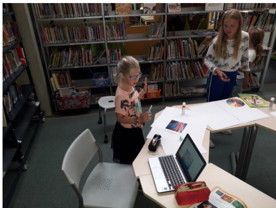
Samenwerken groep 7: Poster thema kleuren.