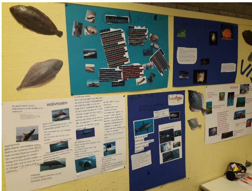
Groep 6 muurkranten.