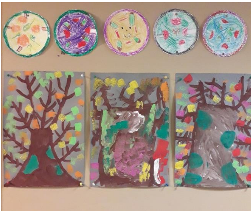
Herfst groep 4

U kunt zich opgeven bij Bianca Straver. Telefoonnummer: 06-11792353